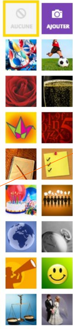
IMAGE Une petite image à associer au mur.

2. En cliquant ici, il est possible de choisir qui va pouvoir accéder au mur pour le lire, le modifier...